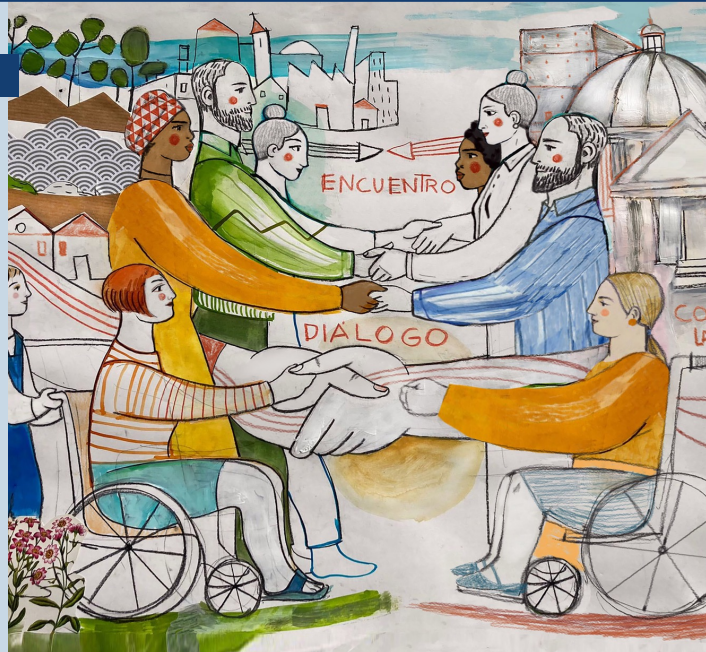
Encuentro con las instituciones 300. Ilustración: La Mari Muriel