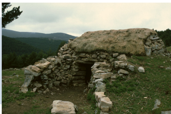
Chozo de las Desecadas.