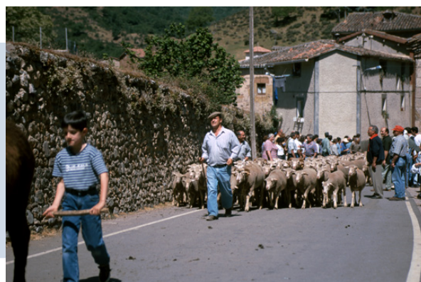
Rebaño trashumante entrando en Brieva.