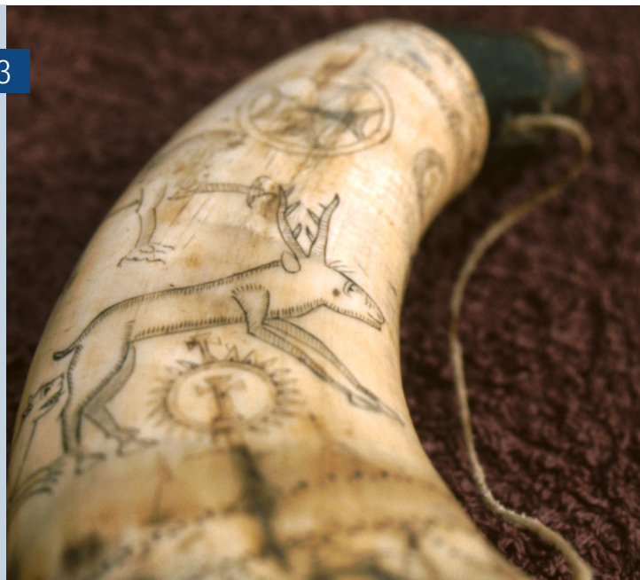
Colodra (Villoslada de Cameros).